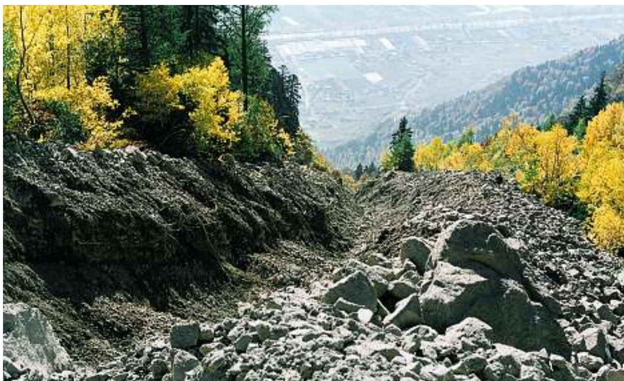
Die Wurzeln an der linken Gerinneflanke zeigen deutlich die Grenze zwischen den rund drei Meter hohen Levées und der ebenso tiefen Erosion nach dem Murgang vom Oktober 2000 in Fully mit einem Volumen von mehr als 300 000 m 3 .