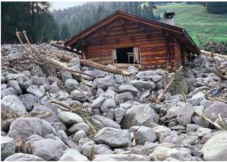
Praktisch kein Feinmaterial, dafür viele Bäume und Blöcke zeichnen den Murgang des Chummerbachs bei Davos im Sommer 1999 aus.

Ein Blick auf das stark verwitterte Einzugsgebiet im Illgraben. Die grossen Mengen an vorhandenem Lockermaterial im steilen Gelände begünstigen die Entstehung von Murgängen. Starke Niederschläge führen im Illgraben mehrmals jährlich zu Murgängen.